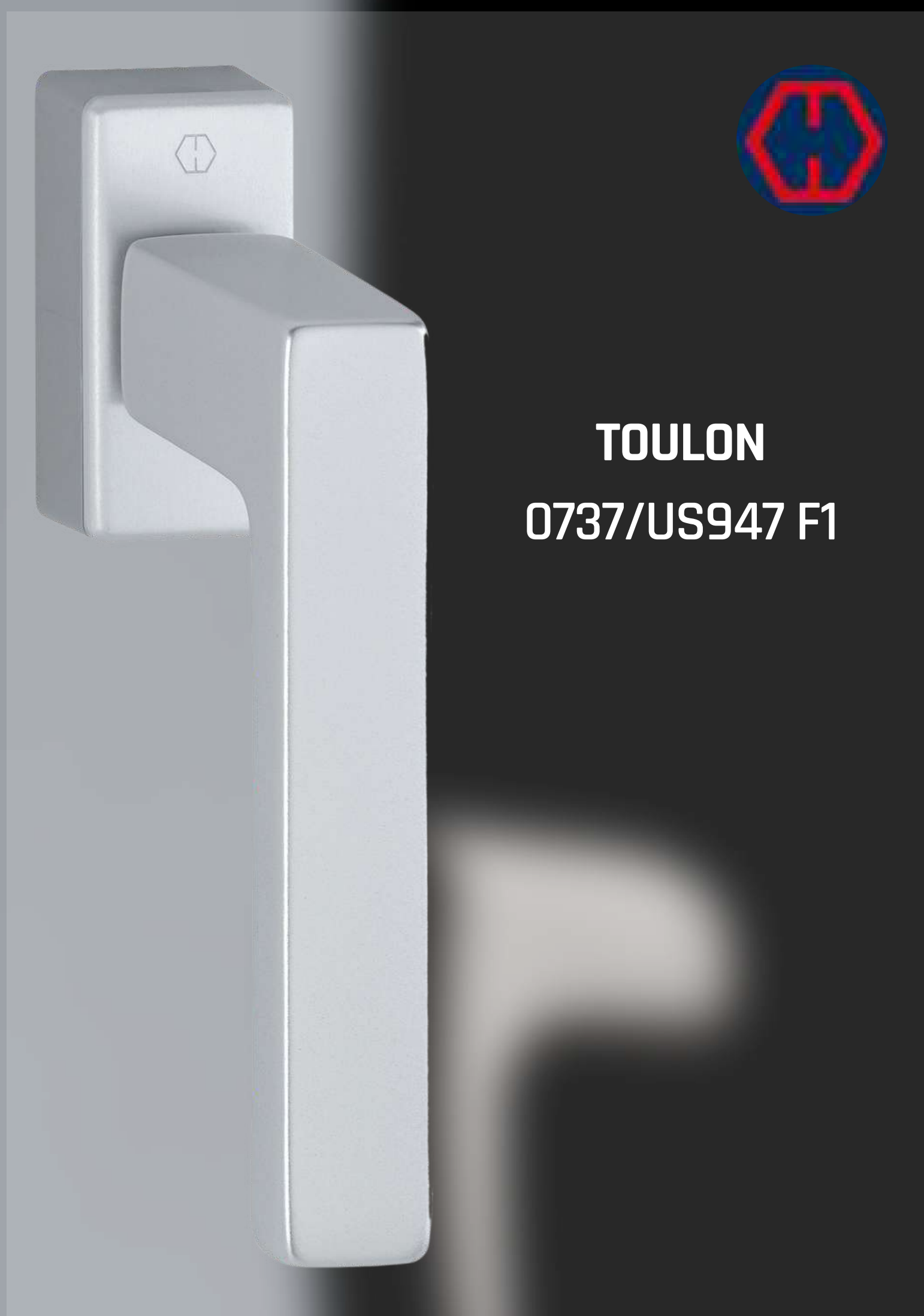
TOULON 0737/US947 F1

Martellina DK HOPPE in alluminio con Secustik ® e VarioFit ® :